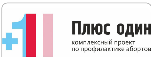
Плюс один комплексный проект по профилактике абортов