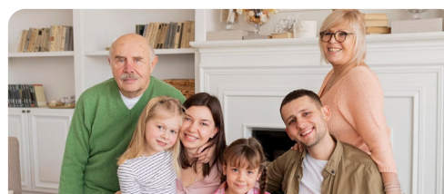
Открытый конкурс семей «Это у нас семейное»