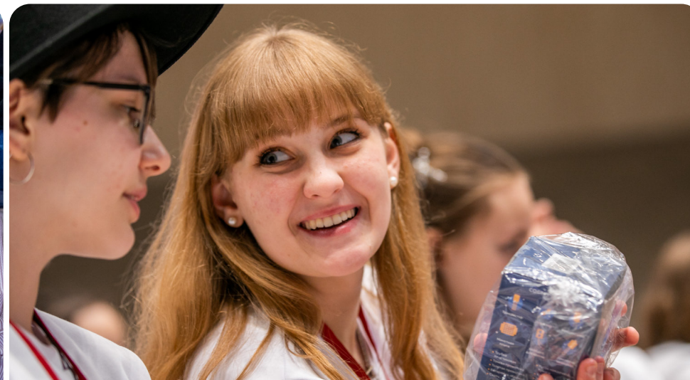
«Подарить детство» родителю

Летучие команды формируются в каждом субъекте Российской Федерации в рамках конкурса «Премия Первых», через регистрацию на платформе Движения. В команду входят дети, родители и педагоги, которые отбирают лучшие проекты, выступают экспертами и совместно проявляют проактивную позицию в рамках различных инициатив