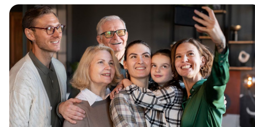
Семейные мастерские «Семейный час»