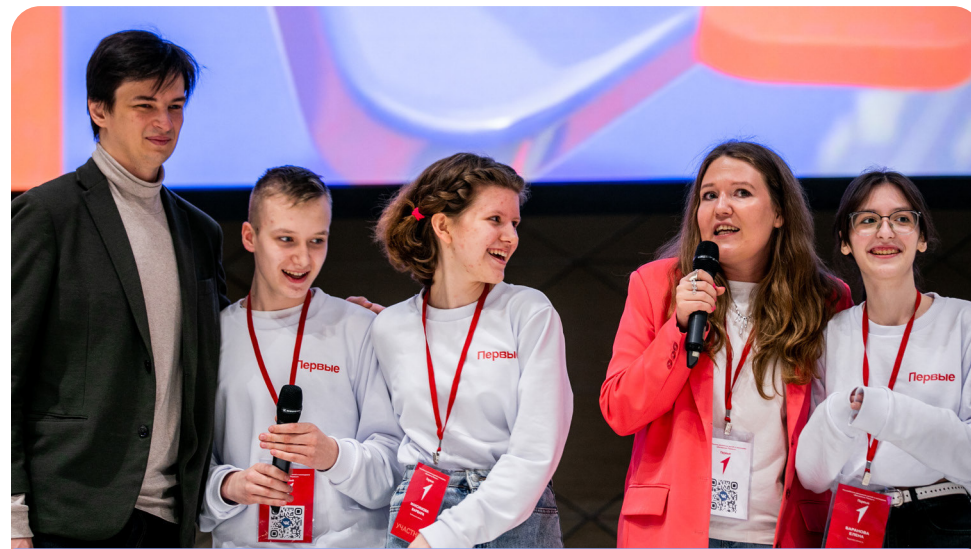
Соавторство\сотворчество с родителями

Участие семей сообщества Движения в семейных сменах партнерских организаций