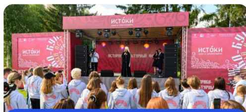
Молодёжный историко-культурный форум «Истоки»